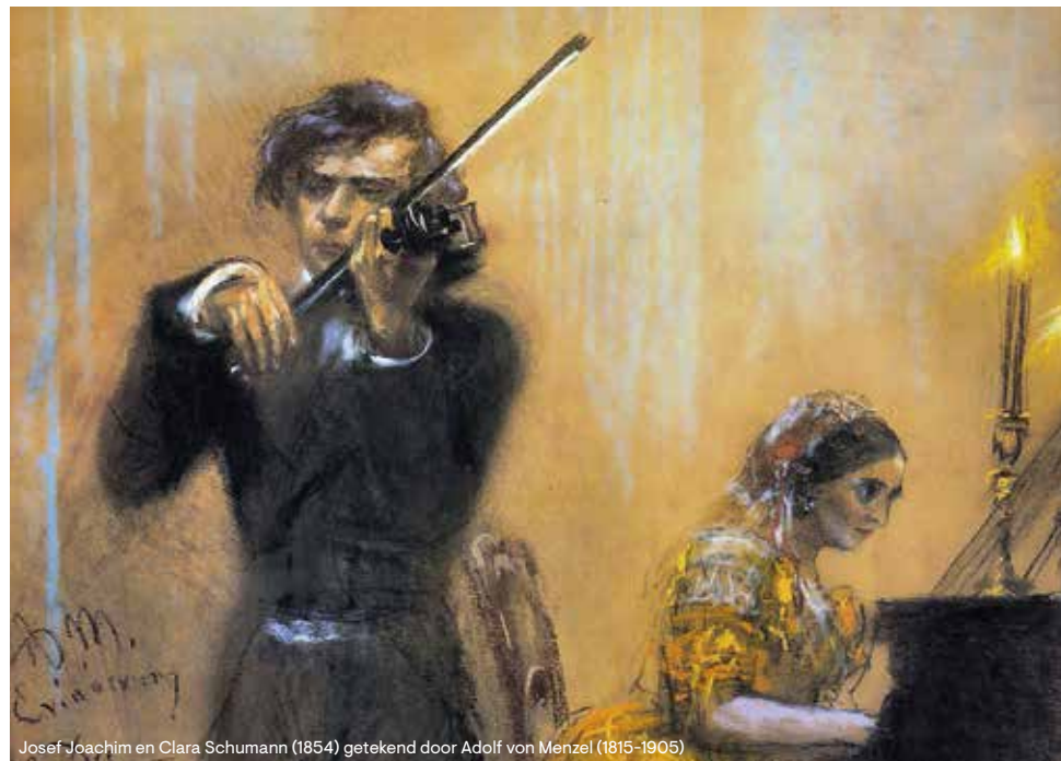
Josef Joachim en Clara Schumann (1854) getekend door Adolf von Menzel (1815-1905)