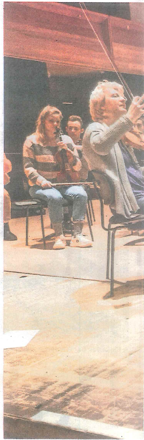
Mondriaans Victory Boogie Woogie .”

De programmeur ziet voorzichtig een gelijkenis tussen de componist Beethoven en de schilder Mondriaan. „Zijn vroege werken zijn herkenbaar, net als bijvoorbeeld Mondriaans Stilleven met gemberpot . Naarmate de jaren verstrijken werden de composities abstracter en complexer. Wat je ook zag bij de schilder, denk aan