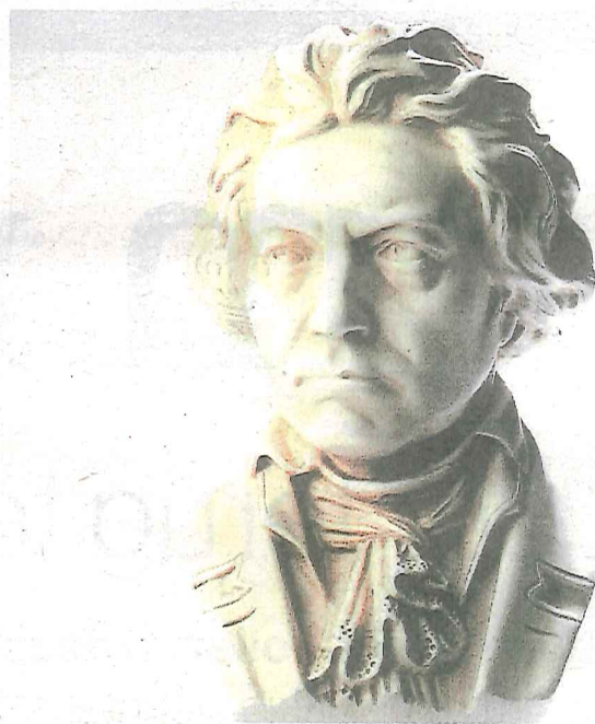
▲ De buste van een nors kijkende Beethoven.