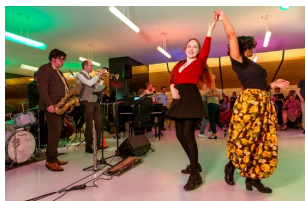
social dance Open Amare.jpg