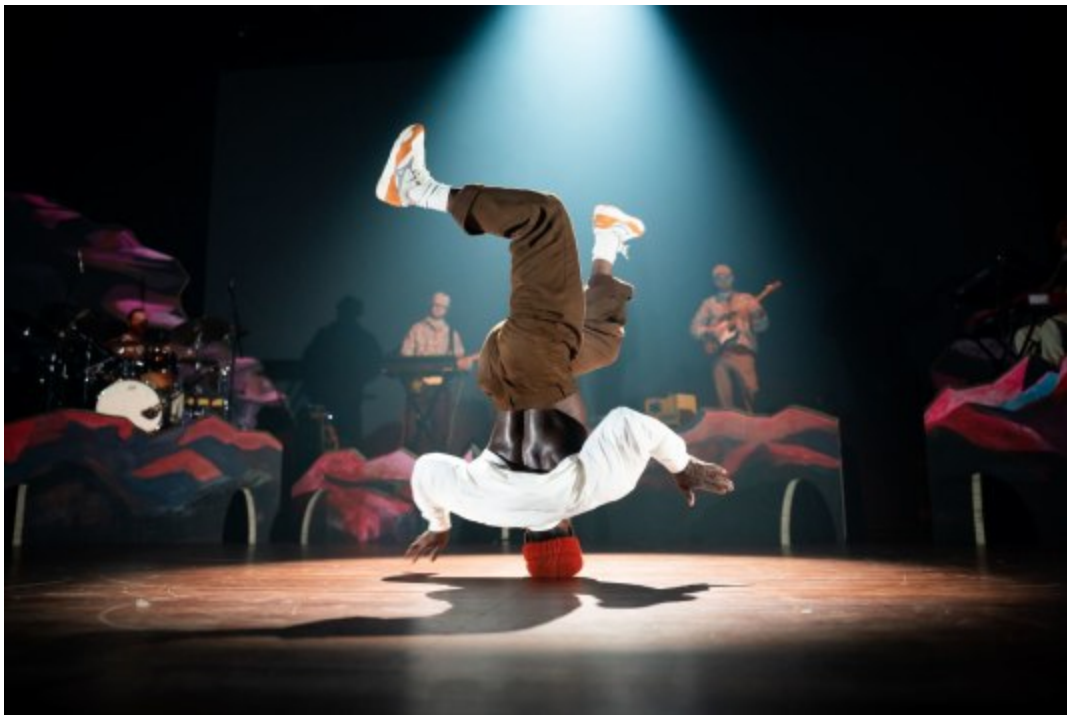
The Ruggeds, Jams & Gems On Tour

Meer informatie over programma en tickets.