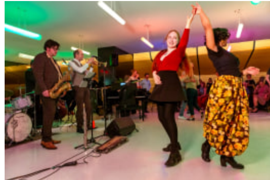
Social Dance Open Amare.