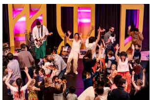
AMARE_Big Bang 2024.jpg