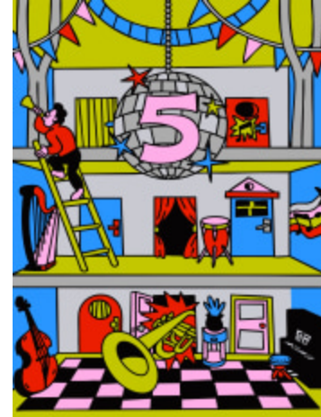
(l) The cat who wanted to change her tale, Thomas Noone Dance. / (r) De Duizend Deuren van Amare, Residentie Orkest