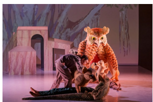
The cat who wanted to change her tale, Thomas Noone Dance.jpg